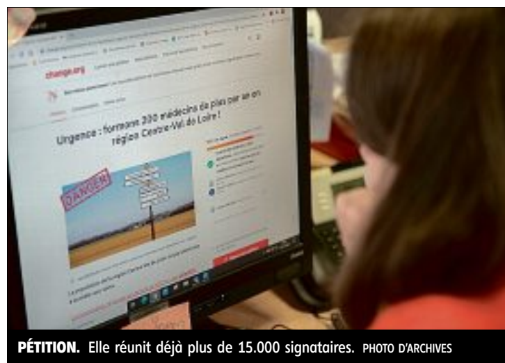
PÉTITION. Elle réunit déjà plus de 15.000 signataires.

Le collectif a fait les comptes, il n'y a pas 300 étudiants en se-