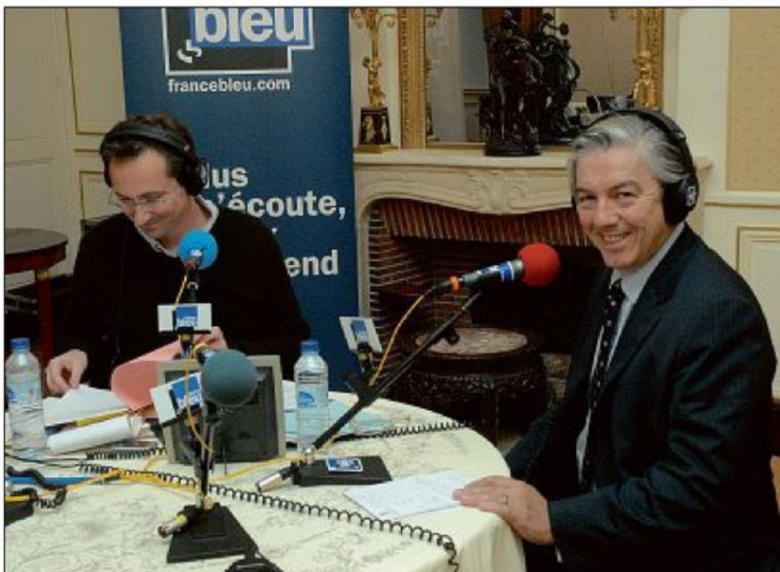
Jean-Paul Charié au micro de France Bleu Orléans, après sa victoire aux élections législatives de 2007.