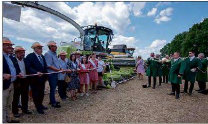
Le chapeau de paille était de mise lors de l'inauguration par les élus nationaux, départementaux et locaux.