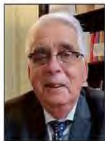
Jean-Pierre Sueur : « Mon seul lobby, ce sont les familles »

La République du Centre - 19 septembre 2022