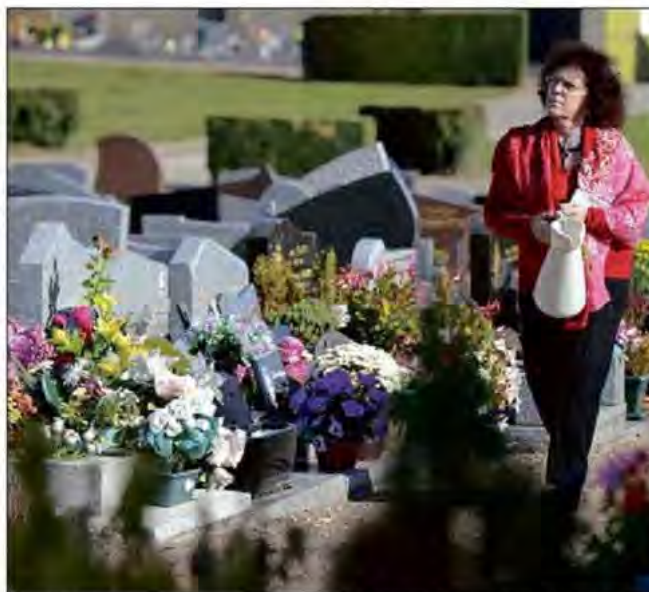
Le rituel de la Toussaint rapproche bon nombre de citoyens de leurs chers disparus.

La mort ? Lors d'un décès brutal (par suicide ou à la suite d'un accident), les maires ou adjoints sont