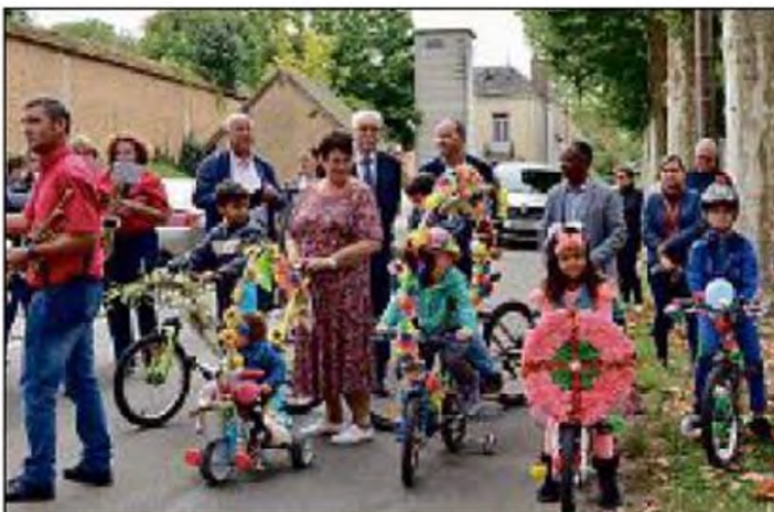
Attention, le départ du défilé de la fête de Saint-Maurice-sur-Aveyron va être donné !